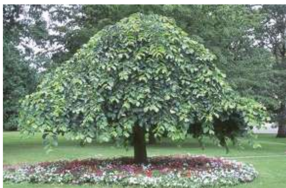
Ulmus glabra 'Camperdownii'