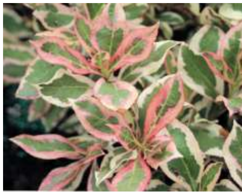
Weigela florida 'My Monet'