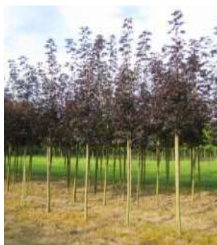
Acer platanoides 'Faassen's Black'