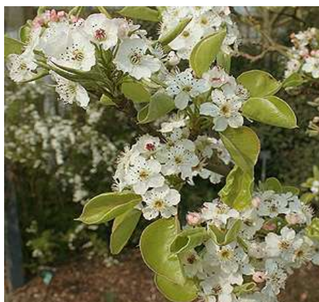
Pyrus calleryana 'Chanticleer'