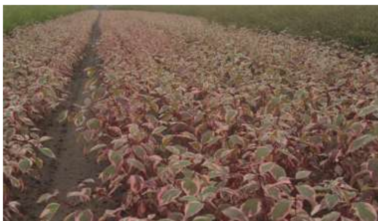
Cornus alba 'Gouchaultii'