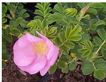
Rosa 'Dagmar Hastrup'