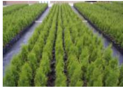
Thuja occidentalis 'Smaragd'