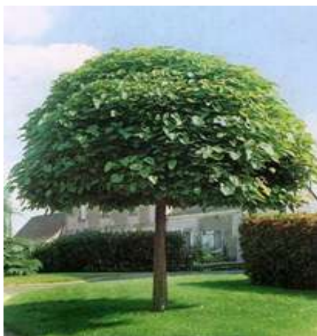
Catalpa bignonioides 'Nana'