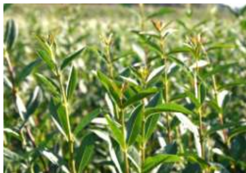
Ligustrum vulgare 'Lodense'